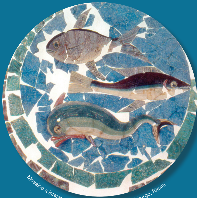
Mosaico a intarsio di pasta vitrea - Domus del Chirurgo, Rimini